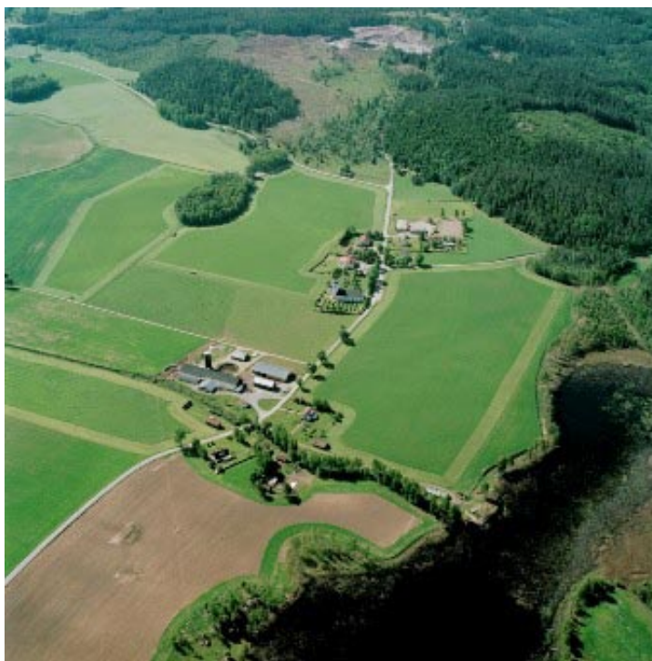
Adelöv från norr

Samlad bebyggelse finns huvudsakligen i anslutning till sjön Noen med företrädesvis permanentboende längs östra sidan från Tärenäs och norrut och med fritidshusområdet Vallstorp på västra sidan. Norr om denna bebyggelse utbreder sig ett stort sammanhängande område med mycket låg exploateringsgrad som enligt miljöbalken 3 kap 2 § ska skyddas mot åtgärder som påtagligt kan påverka områdets karaktär. Särskilt skyddsvärda delar är Adelövsstråket med Stora och Lilla Glan samt Vänstern-Kalven-Frucken, både klassade som ekologiskt känsliga.